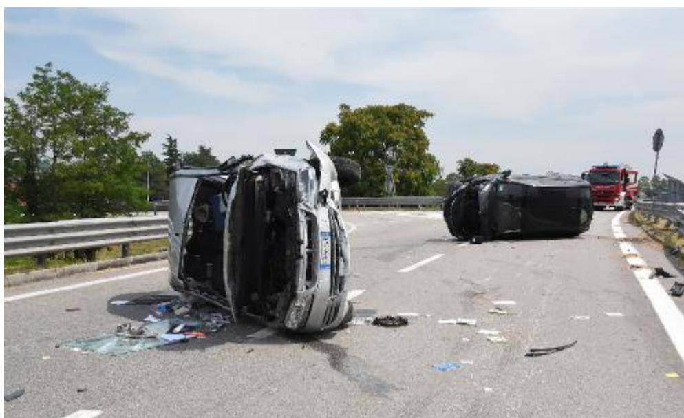
Dopo l'impatto le auto sono rimaste a ruote in aria

La polizia locale, oltre a inviare la pattuglia del Nucleo infortunistica, ha mandato in supporto altri colleghi per la viabilità. La strada è stata infatti interdetta al traffico per alcune ore. A terra nel