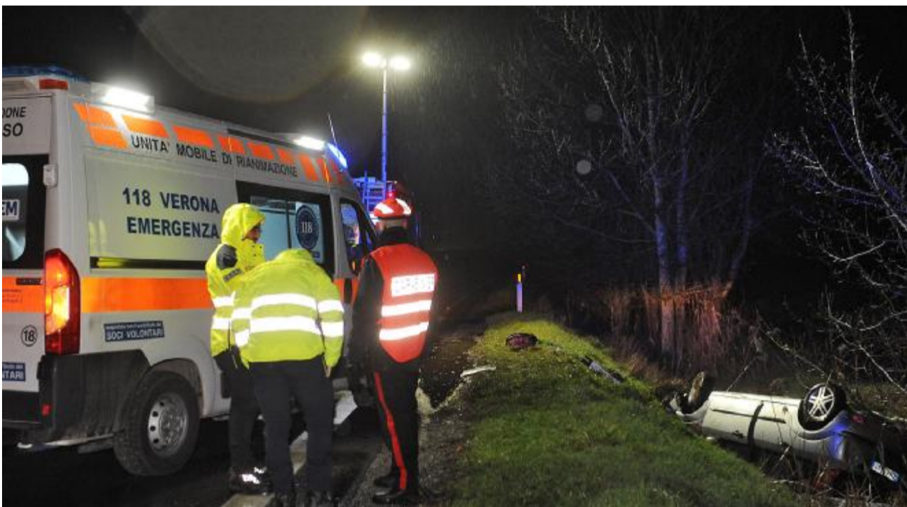
I soccorritori sul luogo dell'incidente sulla corsia sud della Transpolesana, tra Legnago e Villa Bartolomea

Sempre a Villa Bartolomea, nel giugno del 2016, perse la vita un agronomo di 54 anni, di Verona, che su una Toyota Auris stava viaggiando in direzione Rovigo-Verona. Anche in quell'occasione il conducente perse il controllo della vettura e volò fuori dalla carreggiata, centrando il guardrail e rimbalzando poi, dopo un volo di circa una trentina di metri, contro un pilone del cavalcavia che attraversa la «434». •