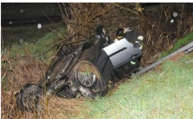
La carcassa dell'auto volata fuori strada lungo la Transpolesana