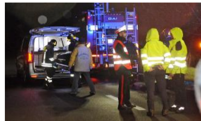
Sul posto sono intervenuti carabinieri, vigili del fuoco e il 118