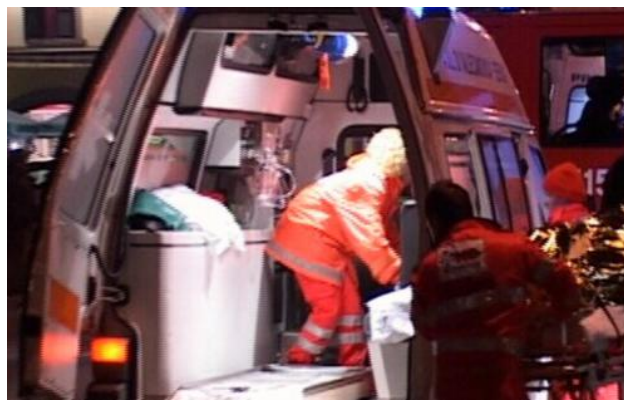
L'investimento è avvenuto sulla Transpolesana. Nella foto, un'immagine d'archivio