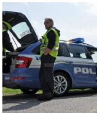
La polizia Stradale

E ieri, dopo la dichiarazione della morte encefalica, i fami-