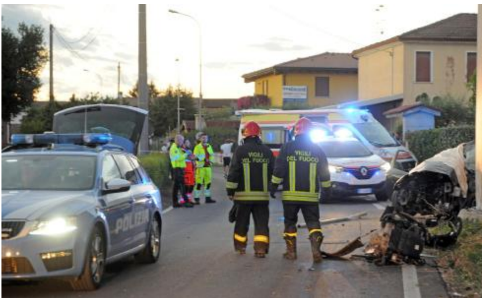
I soccorritori nel tratto di via Barbugine dove è avvenuto l'incidente