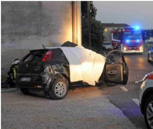
L'auto si è schiantata contro il muro di un'abitazione

I vigili del fuoco non hanno nemmeno provato nemmeno ad estrarre l'uomo dal groviglio di lamiere dell'auto. Mentre gli agenti della polstrada eseguivano i rilievi,