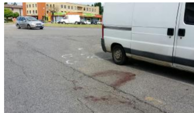
Il luogo dove è avvenuto l'incidente a San Bonifacio