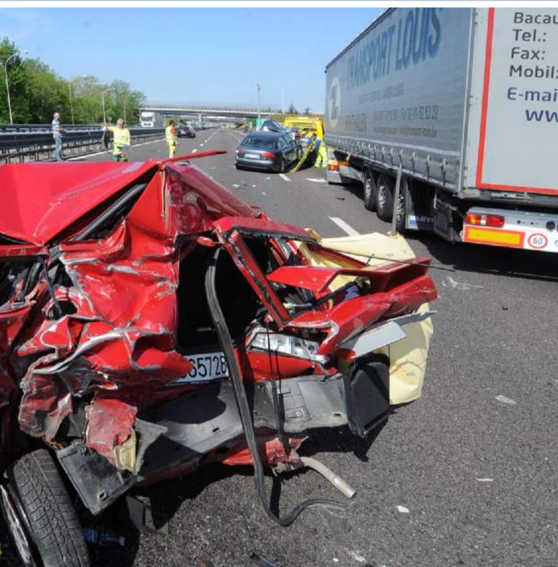
ezzelane, incastrato nelle lamiere della sua Alfa 133. La vittima era di Bassano del Grappa

dalle 13.30 sarà in piazza Arsenale ed a seguire alle scuole Nievio nell'omonima via, per concludere il servizio in piazza Righetti a Quinzano fino alle 19.