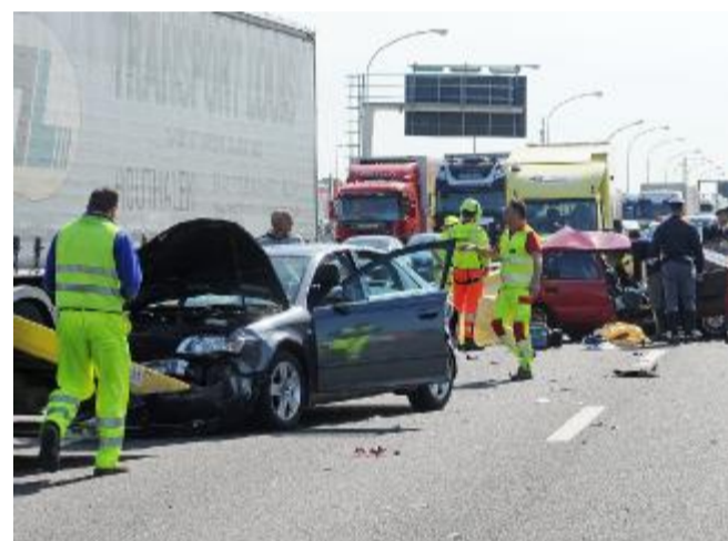
I soccorritori in autostrada: coinvolte quattro auto e un camion

L'autostrada in direzione Milano ha visto il formarsi di code. Soltanto a mezzogiorno è stata completamente riaperta la circolazione dopo una parziale deviazione del traffico sull'A22. Sul posto sono intervenute