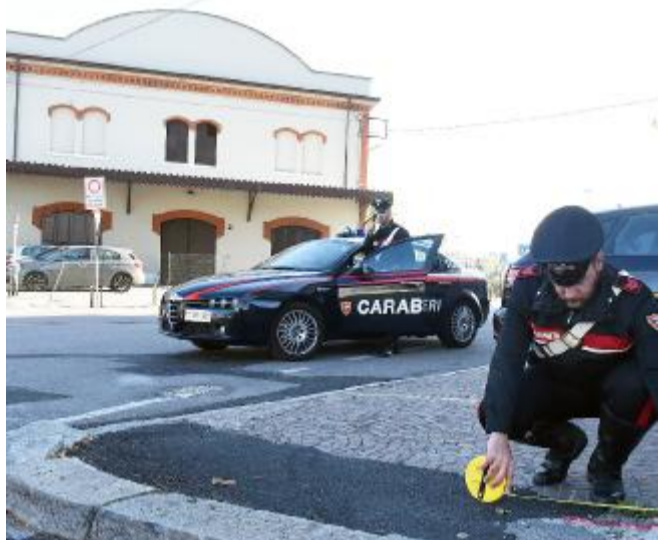
I carabinieri rilevano le tracce di sangue nel luogo dell'aggressione

La storia tra i due si sfilaccia. La donna capisce che può avere una vita quasi normale, inizia a lavorare per una cooperativa, e gli incontri con il padre di sua figlia si diradano. È lei a tirare avanti