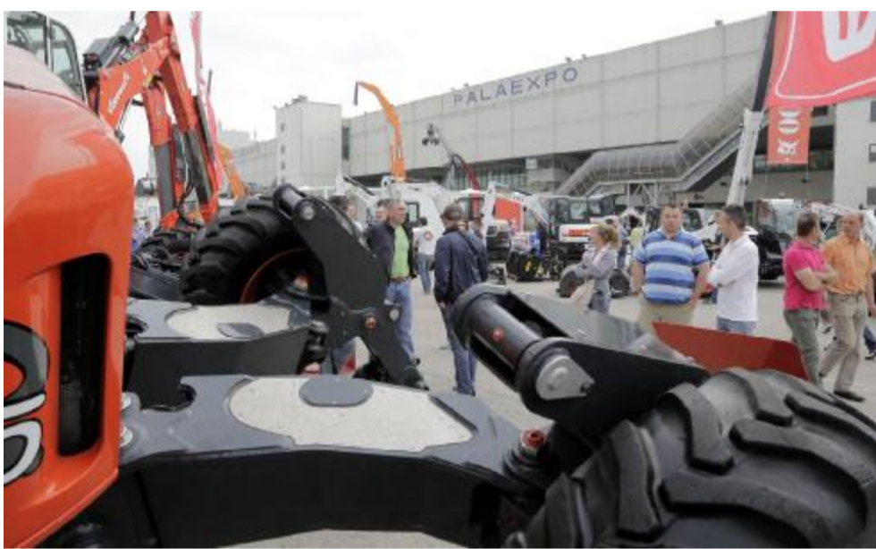
Visitatori tra i padiglioni di Samoter: segnali positivi all'appuntamento a Veronafiore

Veronafiore sa bene che sono i mercati esteri quelli che, di fatto, ancora permettono al settore di sopravvivere: per questo il lavoro sull'incoming