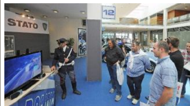
Lo stand della polizia stradale al Samoter

CONVEGNO. Un gruppo di esperti a confronto