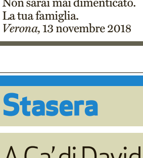
STEFANO VIOLANTE Non sarai mai dimenticato. La tua famiglia. Verona, 13 novembre 2018