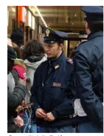
Controlli della Polfer

PORTA NUOVA. Un colpo riuscito, uno sfumato grazie a un vigilantes Ruba zaini e borselli in stazione Un uomo arrestato dalla Polfer Arrestato per furto e tentato furto. Domenica notte, gli agenti della Polfer hanno arrestato un cittadino marocchino, irregolare sul territorio nazionale. L'uomo è già conosciuto per altri recenti arresti. Dopo la segnalazione alla sala operativa della polizia Ferroviaria da parte di una guardia giurata in servizio nella stazione, gli agenti hanno individuato il soggetto e, dall'esame immediato delle videoregistrazioni delle telecamere di sorveglianza, hanno appurato che insieme ad un complice aveva rubato lo zaino ad un viaggiatore appisolato in una sala d'attesa della stazione e, poco dopo, aveva cercato di rubare il borsello ad un altro viaggiatore addormentato, ma era stato costretto a desistere dall'intento per la presenza di una guardia giurata. Il quanto mai tempestivo intervento dei poliziotti, ha permesso di bloccare il giovane marocchino e di assicurarne la giustizia. Arresto convalidato e udienza rinviata. •